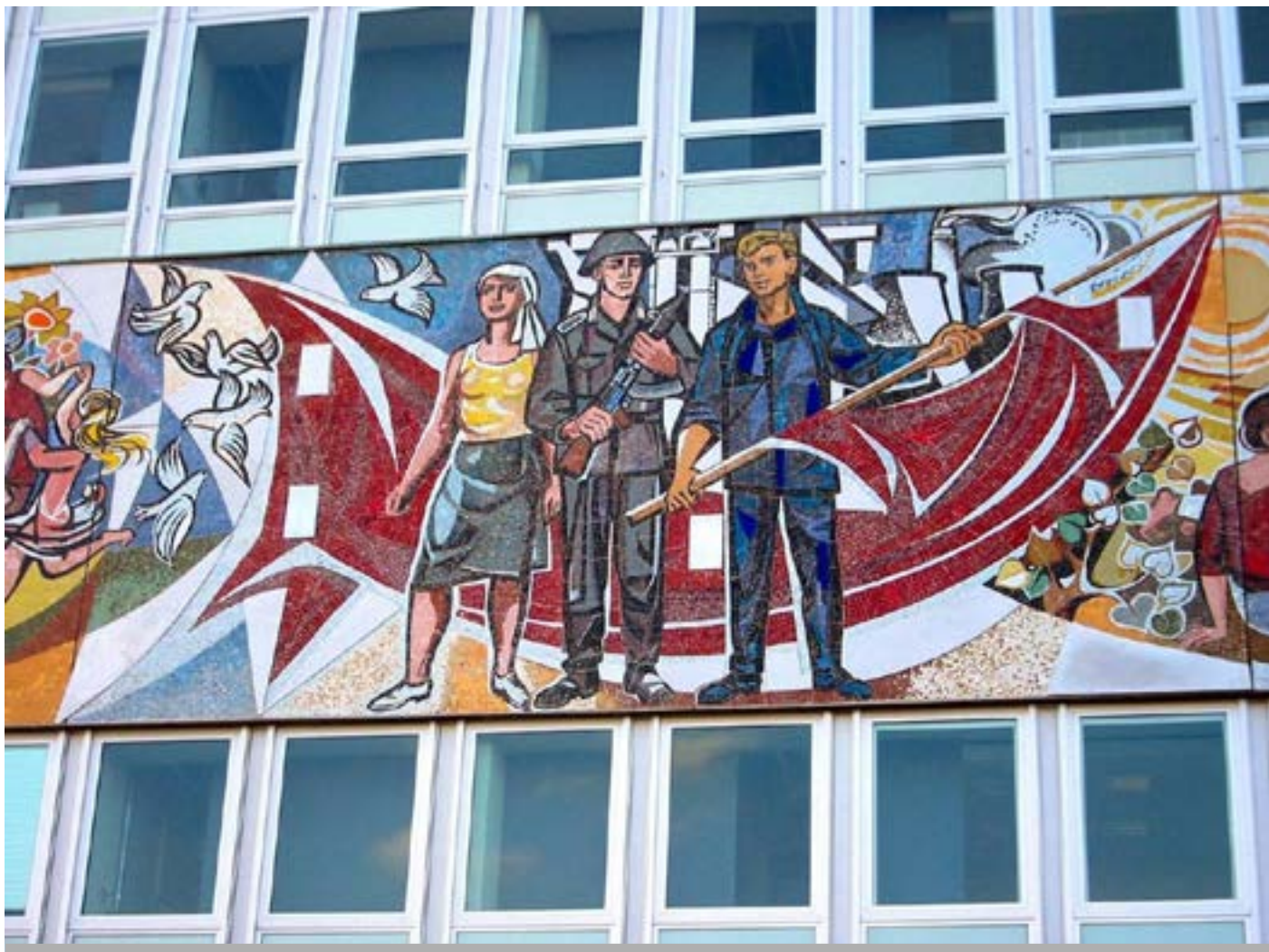
Neoliberalismo progresista e izquierda conservadora

su contrario: matando el espíritu del marxismo recitando la letra del marxismo . En estas condiciones, no es extraño que el descontento social provocado por la caída del nivel de vida (a pesar de los esfuerzos para contenerlo con el endeudamiento masivo) y la falta de expectativas de futuro, haya encontrado su válvula de escape en lo más simple, en la negación de la ideología y sistema de valores progresistas que ha adoptado el capitalismo neoliberal en sus últimos años. Cuyos más entusiastas y activos animadores, paradójicamente, surgen de quienes se proclaman contrarios al liberalismo. Al final se ha creado un totum revolutum , en el que ya no se distingue libertad, de liberalismo económico, ni democracia de libertad para enriquecerse a costa de otros. Y por supuesto, no se distingue la fase histórica del siglo XIX en la que el liberalismo podía ser una propuesta progresista, de la fase actual, en la que tanto el liberalismo como su aborto el neoliberal son ya profundamente reaccionarios.