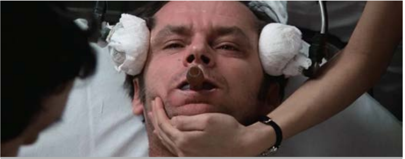
Escena de la película "Alguien voló sobre el nido del cuco"

Los primeros tiempos se hacía sin anestesia ni medicación coadyuvante. El momento de pasar la corriente se perdía el conocimiento y el enfermo no sufría.