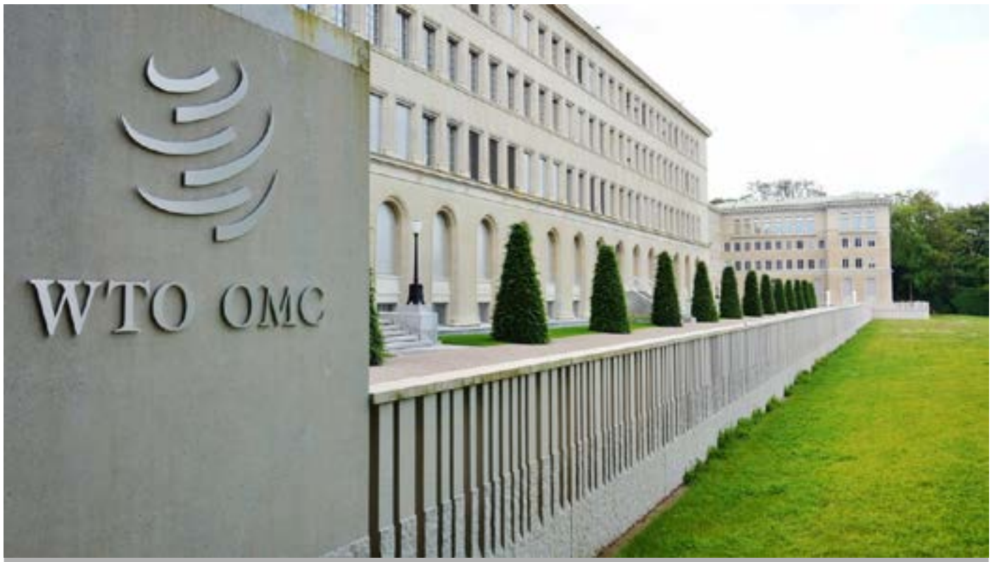
Organización Mundial de Comercio (OMC)