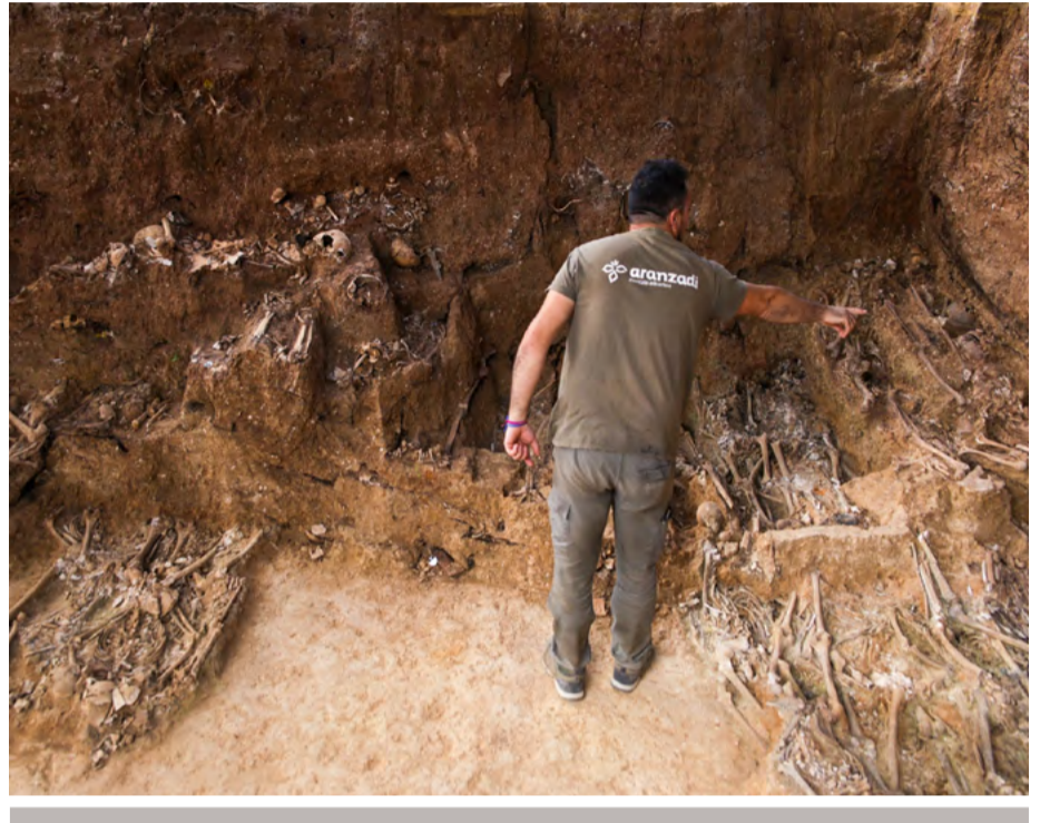
Extremo occidental de la fosa de Pico Reja

den a “población asesinada”, mezcladas como estrategia de ocultación con enterramientos normalizados en ataúdes (2.598), restos de osarios (1.561) y otro “material aislado” (165), según el último informe del equipo de Aranzadi. Los trabajos de exhumación se iniciaron a principios de 2020 con 1,21 millones de euros aportados por el Ayuntamiento de Sevilla, la Diputación Provincial de Sevilla, la Junta de Andalucía y el Gobierno central.