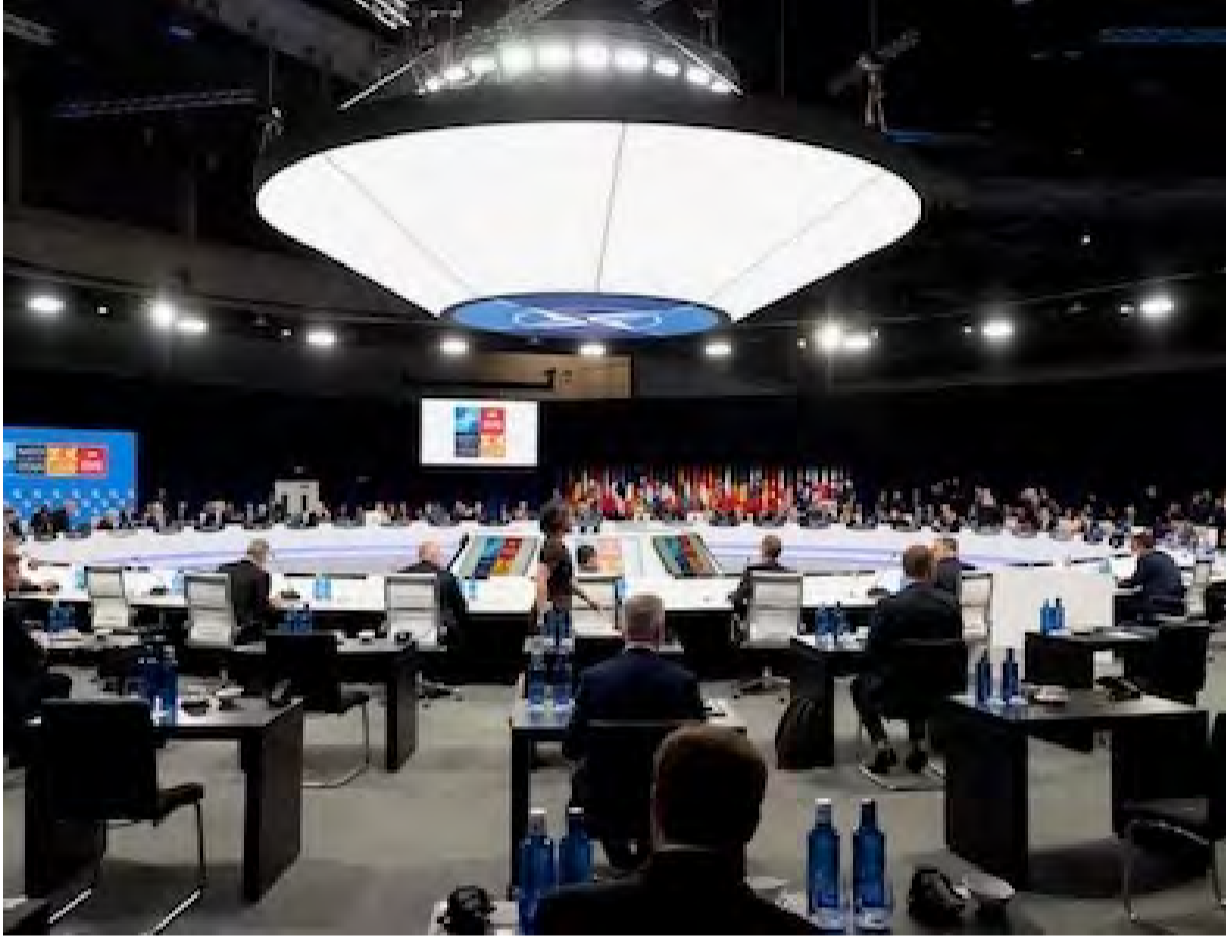
La cumbre de la OTAN en Madrid quiso ser una demostración de unidad y poderío. Pero los países miembros de esa alianza bélica sólo fueron convocados para firmar lo que Washington y Londres ya habían decidido... sin consultarlos. La unidad mostrada en Madrid fue en realidad otra demostración de ese vasallaje que muchos quisieran dejar atrás.

Mientras tanto, la Federación Rusa, que ya no recibe pagos de los occidentales, ha comenzado a vender sus productos, específicamente sus hidrocarburos, a otros compradores, principalmente a China. Como los pagos ya no pueden efectuarse en dólares, Moscú está cobrando en otras monedas. Por consiguiente, los dólares que los clientes de Rusia utilizaban antes para