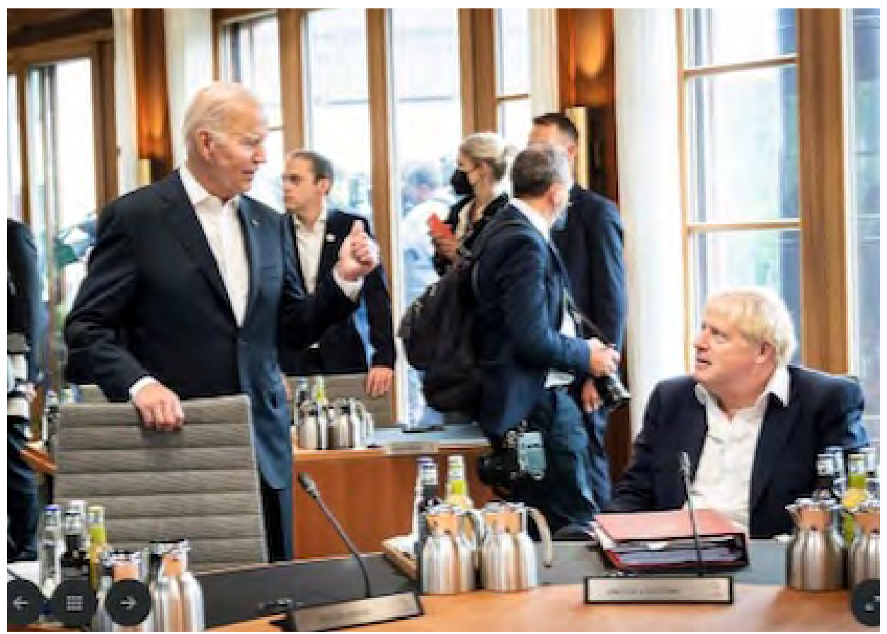
El presidente estadounidense Joe Biden y el primer ministro británico Boris Johnson durante la cumbre del G7 en Elmau, Alemania