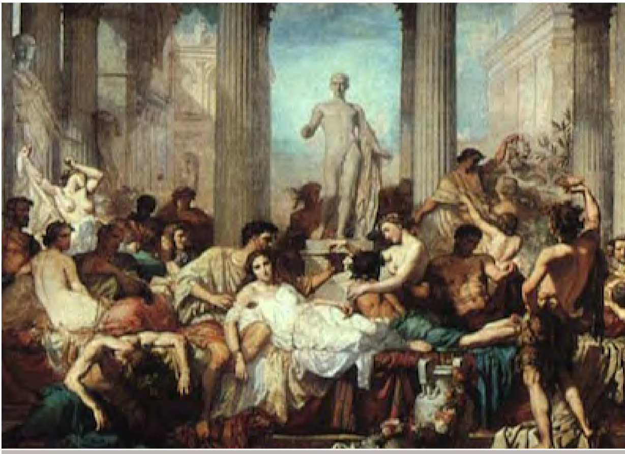
Como Roma, el imperio anglosajón está derrumbándose debido a su propia decadencia.

RED VOLTAIRE | PARÍS (FRANCIA) | 5 DE JULIO DE 2022