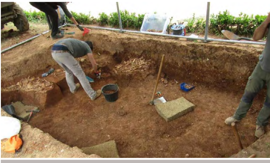
Fosa de Pico Reja

La de los crímenes del franquismo es la historia de una gran ocultación, y lo que se ocultó no fue otra cosa que un exterminio, un verdadero genocidio. La enorme cantidad de desaparecidos, asesinados fuera de las acciones de guerra, que permite hablar al hispanista inglés Paul Preston de “Holocausto español”, no fue algo casual, obedeció a una política planificada, sistemática, que tenía dos objetivos: el exterminio de cualquier opositor, y la creación de un clima de terror que disuadiese a los supervivientes de cualquier resistencia presente y futura. Tales objetivos se contenían ya en el propio plan de sublevación elaborado por el “Director” y cerebro del golpe de Estado contra la República, el general Emilio Mola. La primera de sus “instrucciones reservadas”, dictada el 25