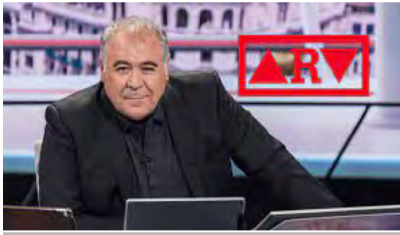
Al Rojo Vivo con Ferreras

Son un par de ejemplos entre mil. Suelo ver también los informativos regionales madrileños de RTVE, a las 14,00 horas. Son copia de la información de TeleMadrid. Por citar un ejemplo de noticias calcadas, una de hace unos meses, se informó que: la subida del precio de la electricidad ha motivado que Metro de Madrid anuncie una reducción del número de trenes en circulación, pero esta reducción del número de convoyes, en un 10%, “no provocará ningún perjuicio para los usuarios”. La misma noticia es dada en RTVE y en la teleayuso de TeleMadrid. Tal cual. Pues si que circulen menos trenes no perjudica a nadie que no lo reduzcan